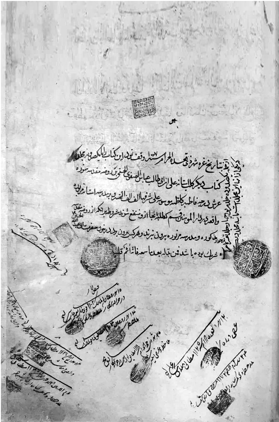
روض الجنان ج ۲ (موزه آستانه، کد ۲۲۸۶؛ شماره ۳۹۱ دانش پژوه)