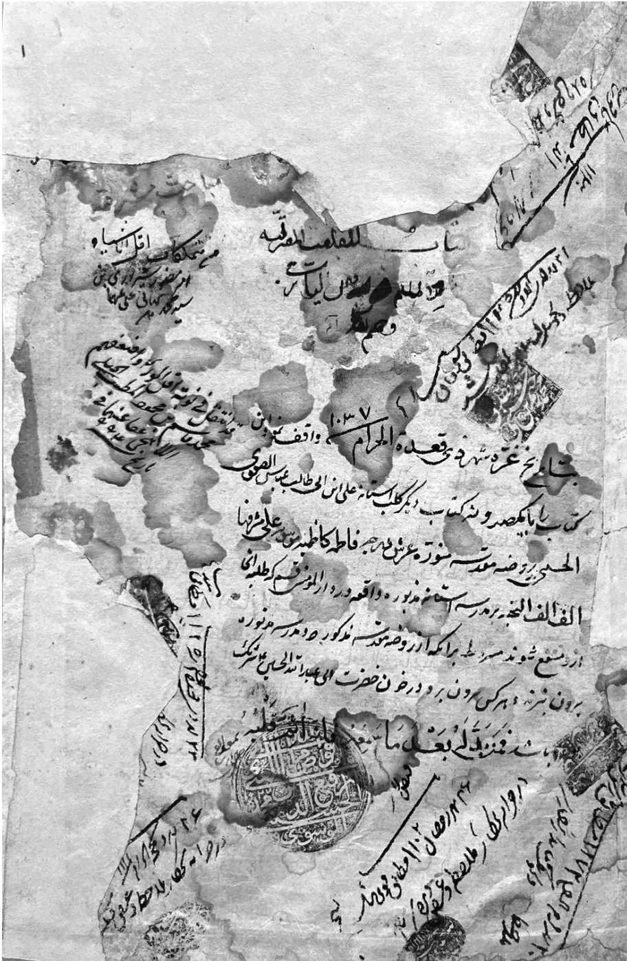
المباحث المشرقیه (کتابخانه آستانه معصومیه، شماره ۳۸۶ قدیم و ۱۰۱۹ جدید)